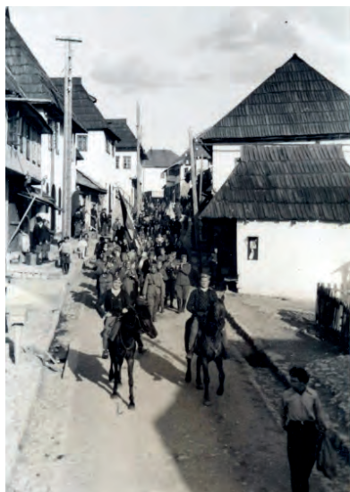
Четници славе Врбицу у Новој Вароши 12. 3. 1942