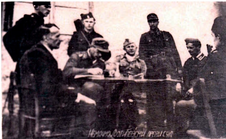
Четничко-љотићевски преки суд у Пожеги 1941–1942, НМУ