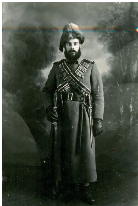
Четник у униформи 1942, НМУ