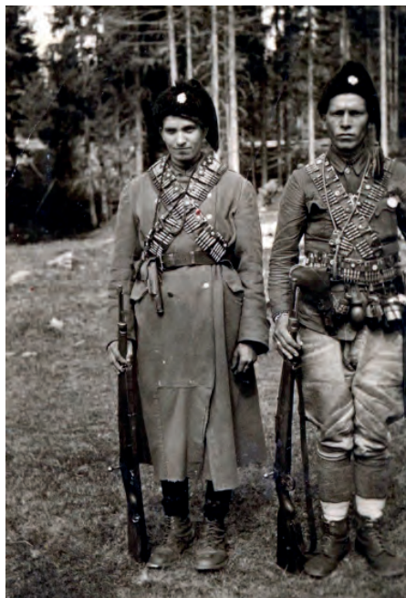
Два четника са опремом 1942, НМУ