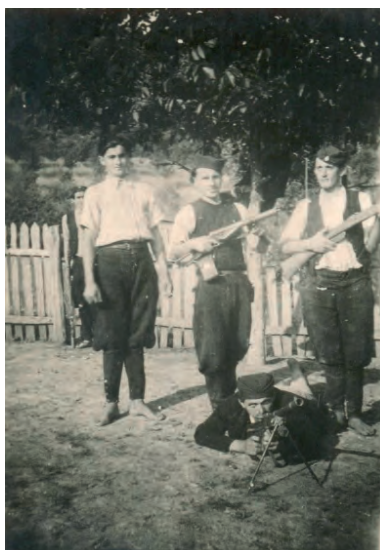
Латвички четници 1942, НМУ