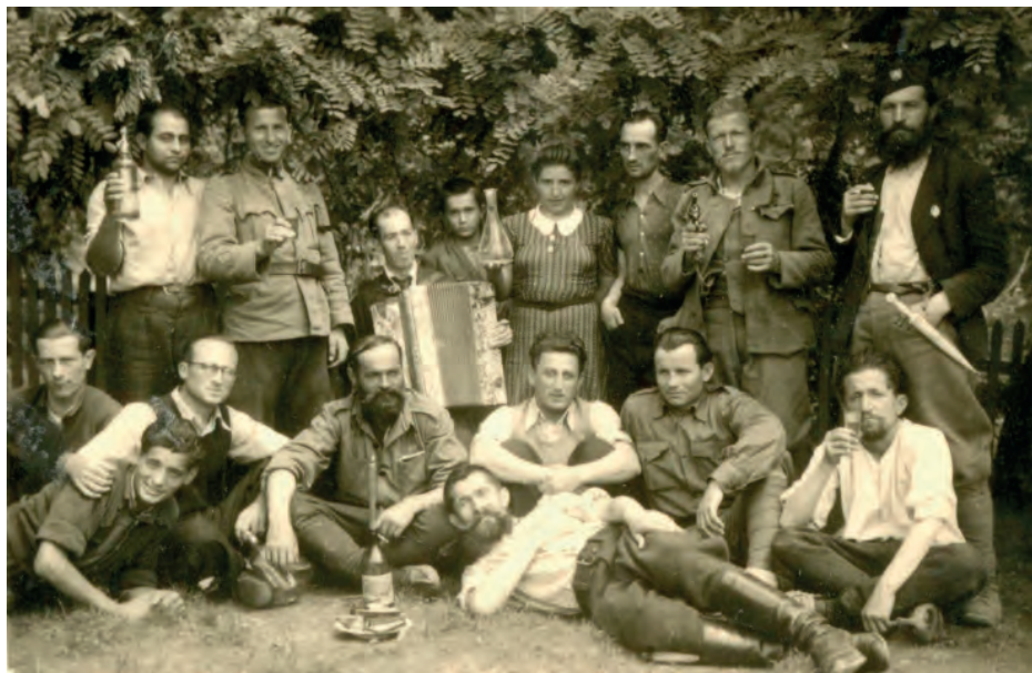
Ивањица – група четника на слави Светог Павла 24. 6. 1942