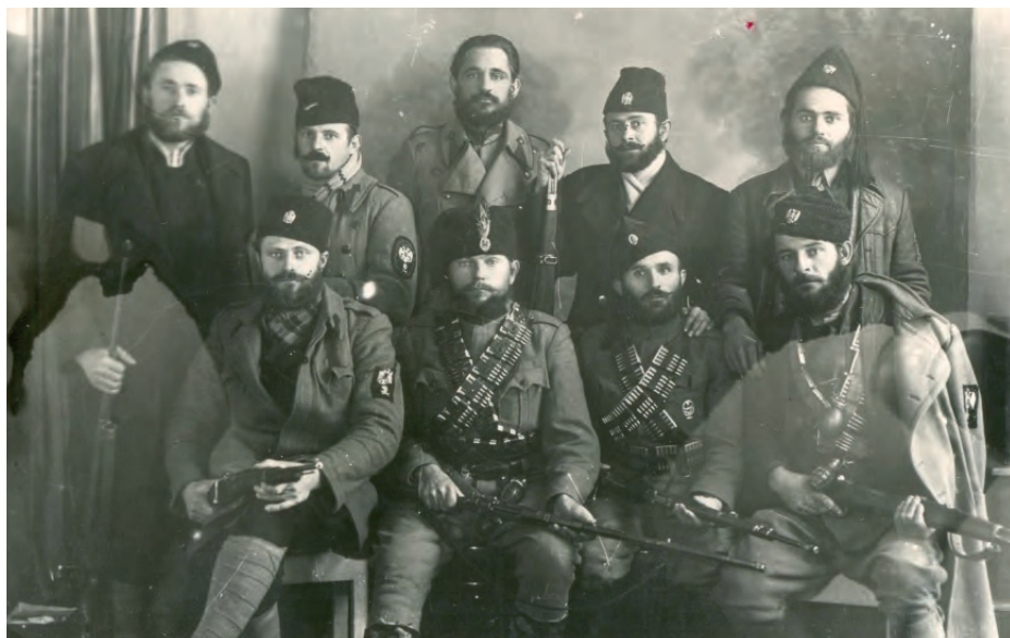
Група четника 1942, НМУ