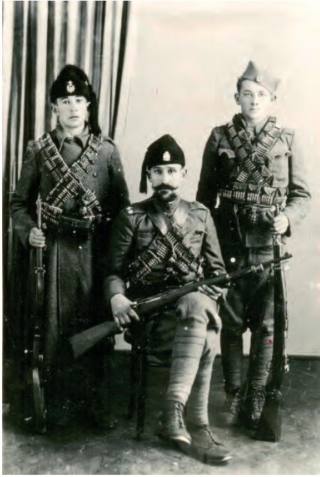
Четници у униформи 1942, НМУ