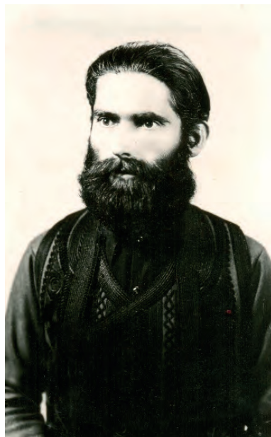
Четнички официр 1942, НМУ