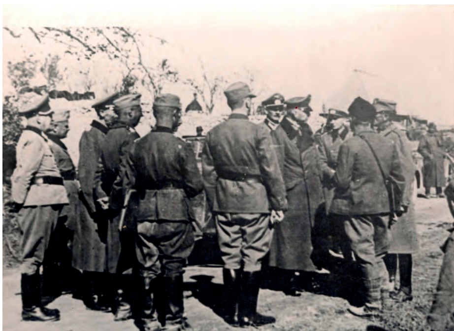
Четник Раде Радић на Ситници 1942, у друштву немачких официра