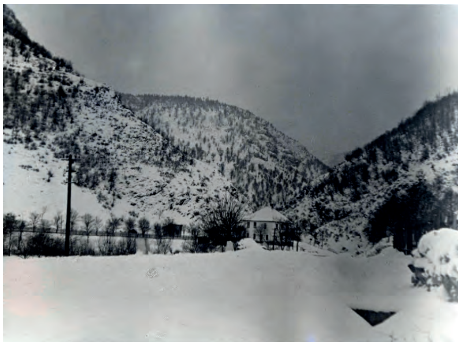
Кокин Брод, место где су вођене борбе између четника и партизана 1942, НМУ